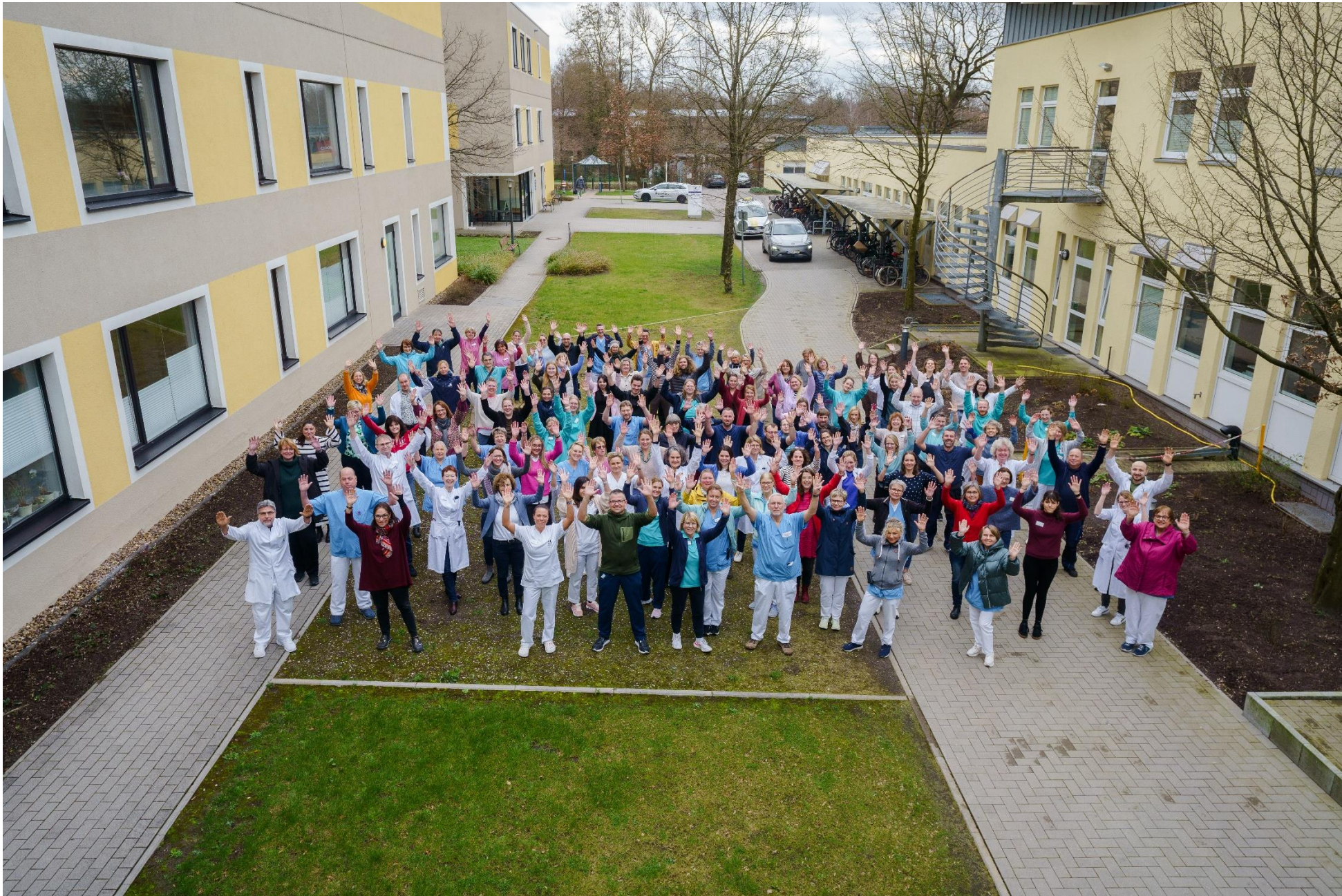
Patiententag Herzchirurgie 16.11.2024